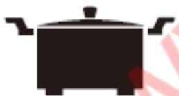
Каструля з ніжками