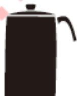
Зовнішній діаметр менше 12 см