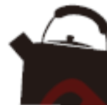
Чайник з нержавіючої сталі або емальований