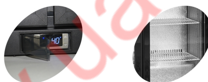
Защитная крышка термостата