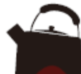
Чайник з нержавіючої сталі або емальований