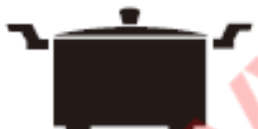
Каструля з ніжками