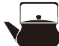
Посуд зі сплаву з низьким вмістом заліза