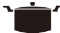
Каструля з випуклим дном