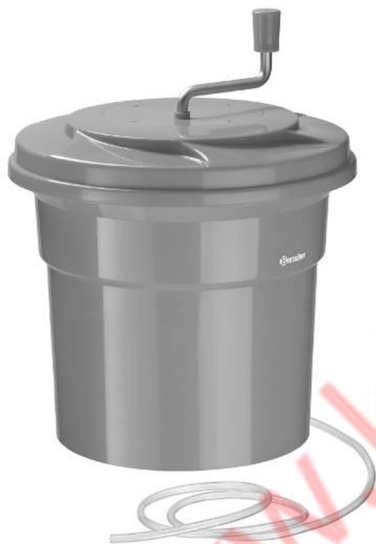
K1-25L / 120709