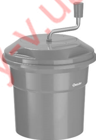
K1-12L / 120710

Оригінальна інструкція з експлуатації V1/0317