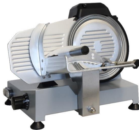
FA 220 GC*