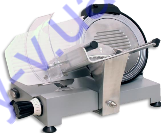
FA 300 GC* (під замовлення)