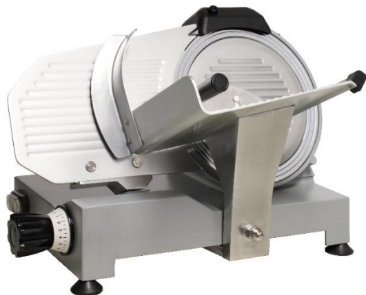
FA 250 GC*