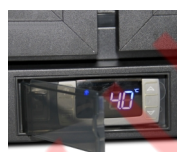
Защитная крышка термостата