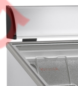
Информационное табло с подсветкой по заказу (вспомогательная комплектующая деталь)