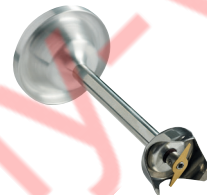
Couteau standard 2 lames Réf. : AC531