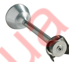
Disque batteur Réf. : AC522