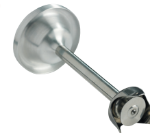
Disque batteur Réf. : AC532