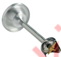
Couteau émulsionneur Réf. : AC530