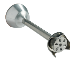
Disque émulsionneur Réf. : AC523