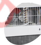
Кронштейн для подвешивания на стену