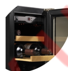
Деревянные выдвижные полки