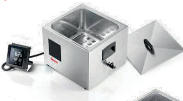
SOFTCOOKER SR 2/3 WI-FOOD