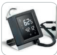
Comandi touch Touch controls