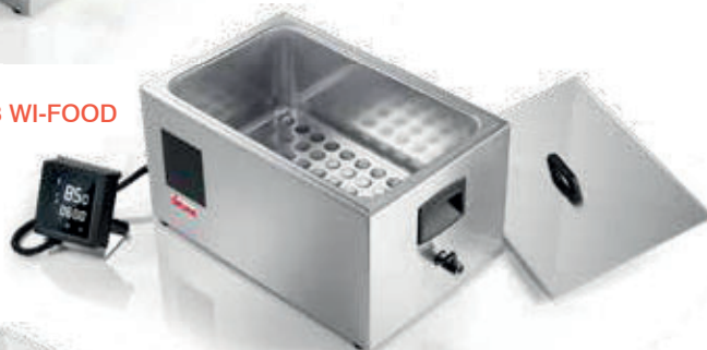
SOFTCOOKER SR 1/1 WI-FOOD