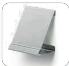
Pratica staffa per display The practical bracket for the display box