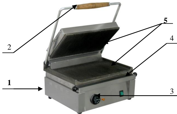
Рис. 1 Гриль контактний 1 – корпус, 2 – ручка, 3 – термодатчик, 4 – ємність для жиру, 5 – жарочні поверхні.