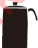
Зовнішній діаметр менше 12 см