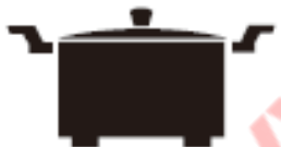
Каструля з ніжками