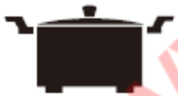
Каструля з ніжками