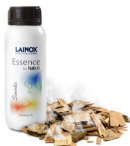
SMKE - 0,5 л. Аромат Smoke, копчение