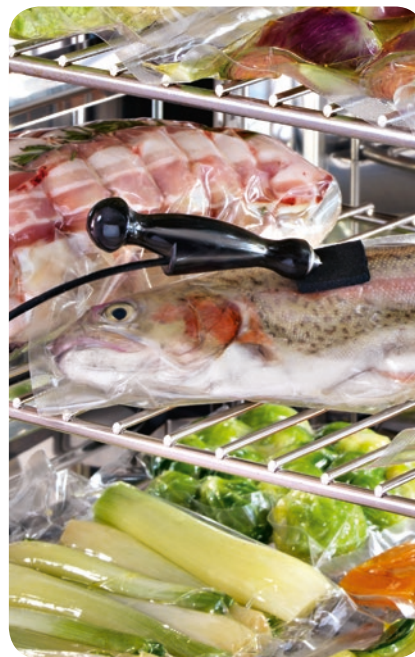
Температурный щуп Ø 1 мм