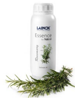
ARDR - 0,5 л. Аромат розмарина