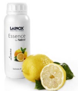
ARDL - 0,5 л. Аромат лимона