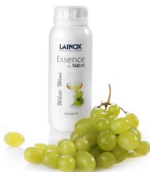
ARDW - 0,5 л. Аромат белого вина